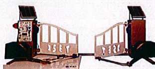
Le portail solaire automatisé

Visite des ateliers Bois Agencement Electrotechnique SEN Structures Métalliques Mécanique Productive